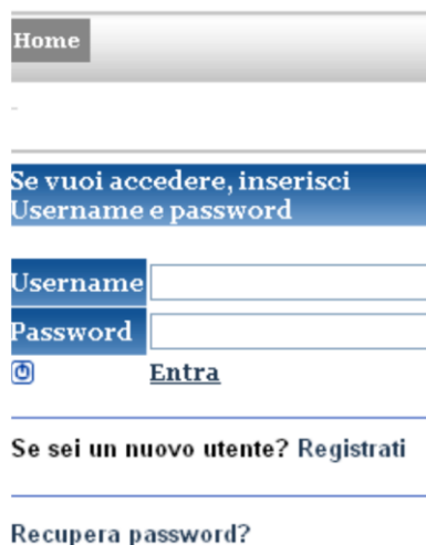
Fig. 1 – Registrazione

Per iniziare la procedura online di inserimento e invio della manifestazione di interesse occorre registrarsi sul sistema on line. Per potersi registrare il candidato dovrà cliccare sul link " Registrati " disponibile nel box a sinistra dell'Home Page del sistema (Fig. 1).